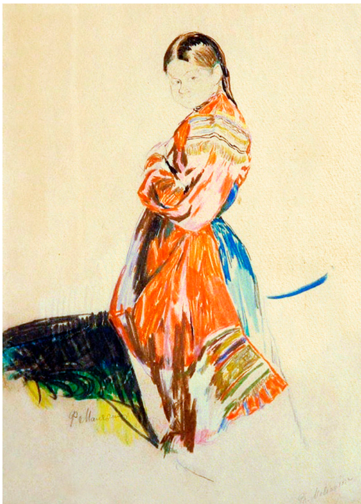
Ф.А. Малявин. В народном costume. 1910-е. Бум., граф. и цв. кар. 41x29. Музей русского искусства им. Марии и Михаила Цетлиных Рамат-Ган, Израиль