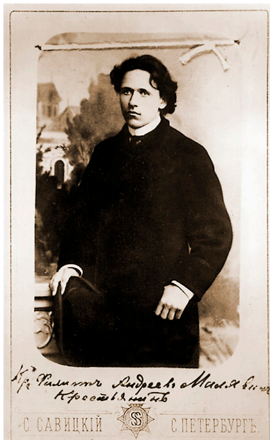
Филипп Малявин (1869–1940) Академия художеств. 1892. РГИА

Входом в дом служило парадное крыльцо, оформленное портиком с колоннами и классическим фронтоном. К коридору примыкал центральный зал. Два высоких окна, открывающих доступ к естественному освещению, и метраж в 96 кв.м позволили обустроить пространство самой большой комнаты дома под мастерскую. Фронтальная глухая стена зала прекрасно подходила для размещения большеформатных малявинских холстов. В качестве двух боковых входов (для прислуги) использовались крыльца с южной стороны, впрочем, они могли быть пристроены новыми владельцами после 1900 года. Вероятно на-