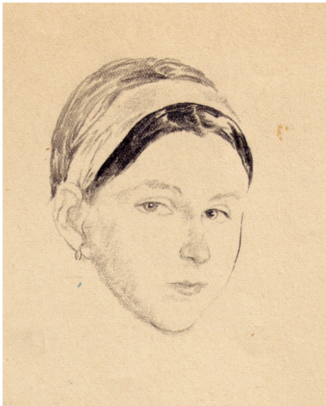
Ф. А. Малявин. Голова девушки. Фрагмент. 1900–1910-е Бум., кар. 45x33. Галерея «Лаврушин»