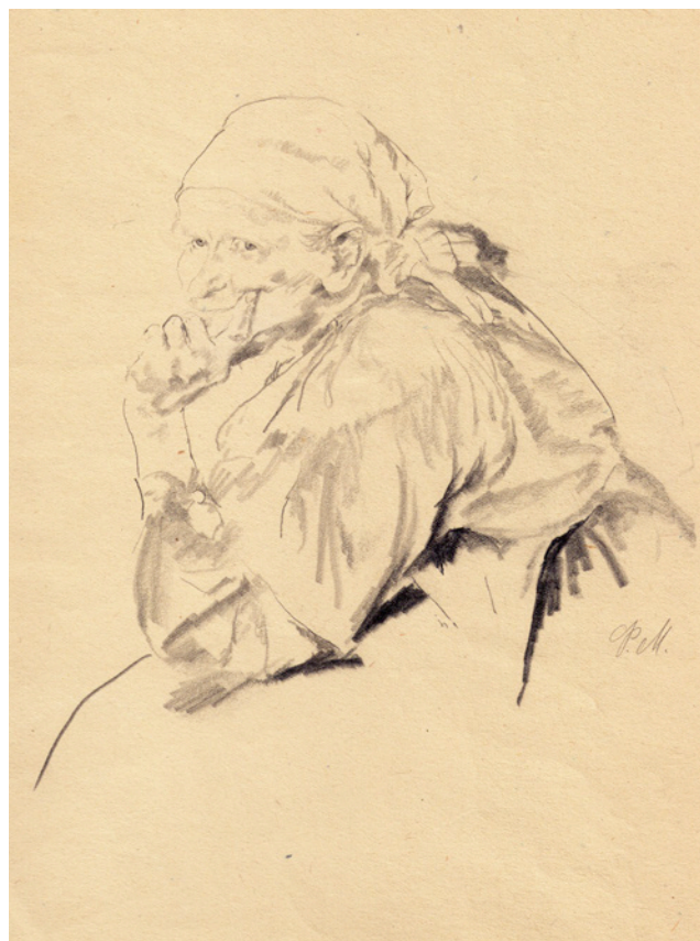
Ф. А. Малявин. Портрет старухи. Начало XX в. Бум., кар. 22x18. Галерея «Лаврушин»

«В имении, где поселился художник, была устроена удобная мастерская. Этюды девушек в живописных сарафанах висели по стенам светлой, просторной мастерской. Я жадно смотрел по сторонам. Вот портрет старухи у печки. Тёмное, морщинистое лицо, цепкие трудовые руки. Вот девушка идёт по солнцу с вязаньем в руках. Вот огромный портрет Репина, портрет во всю стену, писанный широкими, в ладонь, мазками. <...>. Вот над чайным столом висит малявинский пейзаж: широкий, освещённый солнцем луг, небольшой лесок на бугорке, и видна маковка церкви. Всё писано широко и свободно, как будто единым махом» 10 .